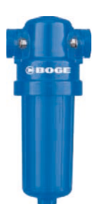
Z 20 N – Z 250N