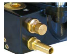
Bouton de test