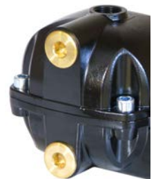
3 Raccordements d'admission Installation facile