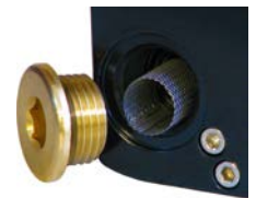
Tamis intégré pour protéger la vanne