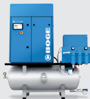
C 15 DR