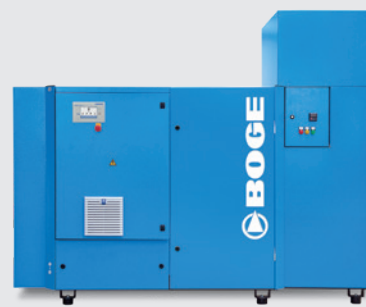
SF 40-3 BLUEKAT