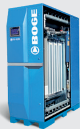
Générateur de membrane N M