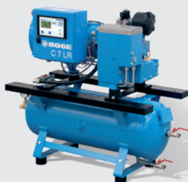
C 7 LR