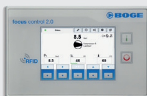
focus control 2.0