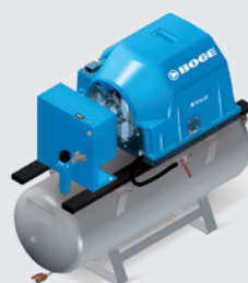
PO 8 LDR