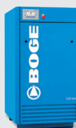
SC 6 (Top Air)