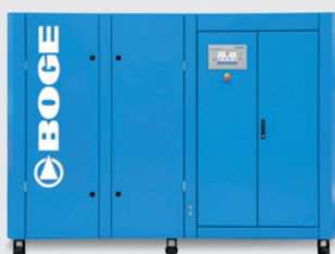
SO 61-2 FW