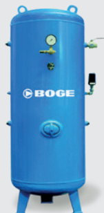
Réservoir d'air comprimé