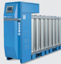
Générateur d'azote N P Générateur d'oxygène O P