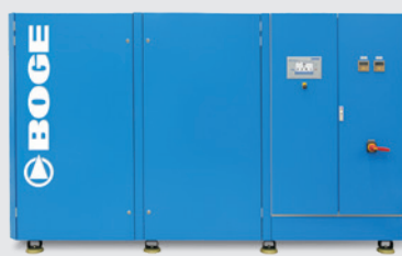
SO 480-2 W