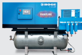
Compresseur tout en un Paintline