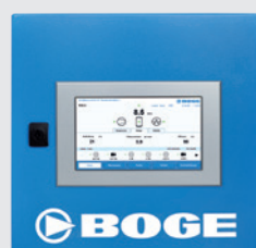
airtelligence provis 2.0