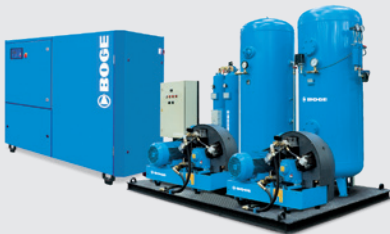
Installation d'air comprimé Flexpet