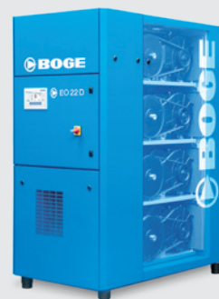
EO 22 D