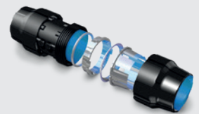
Système de tuyauterie AIRficient