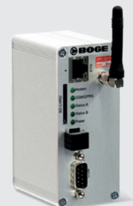
Outil de diagnostic à distance airstatus