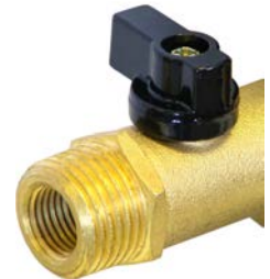
Fontion double entrée