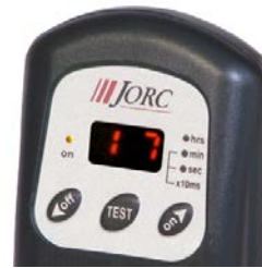
Affichage visuel du cycle de fonctionnement en cours