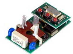
Processeur numérique, vous offrant une synchronisation de cycle exceptionnellement précise