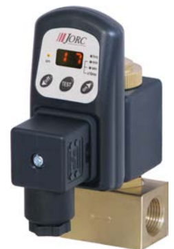
Egalement disponible en version vanne OPTIMUM

JORC est certifié NEN - EN - ISO 9001:2015